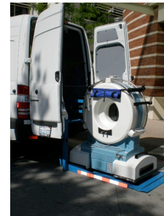
Вариант 2 – перевозка и использование на месте оказания помощи вне автомобиля